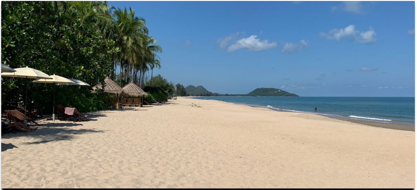
Traumstrand ganz für dich alleine