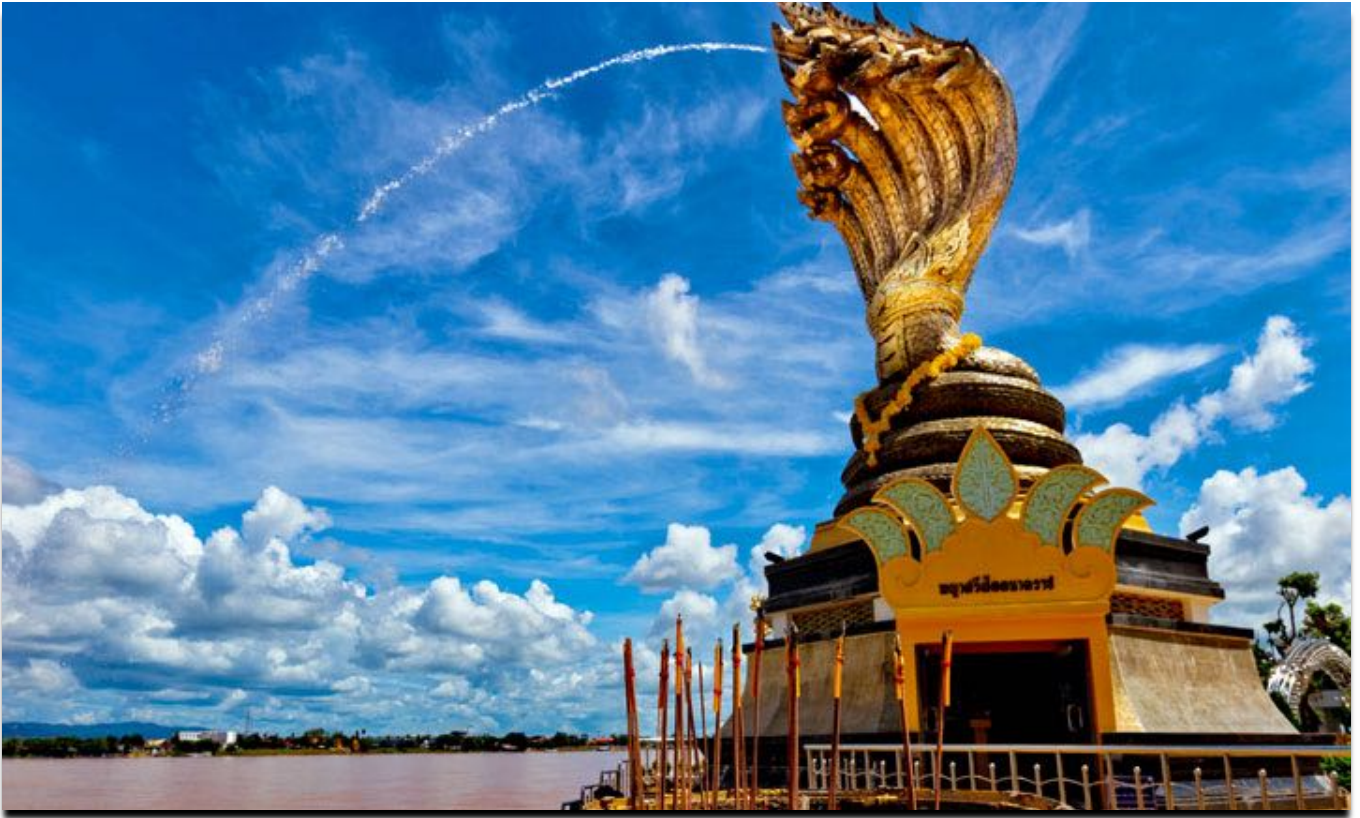
Während der Reise begegnen uns geschichtsträchtige Sehenswürdigkeiten und prachtvolle Tempel