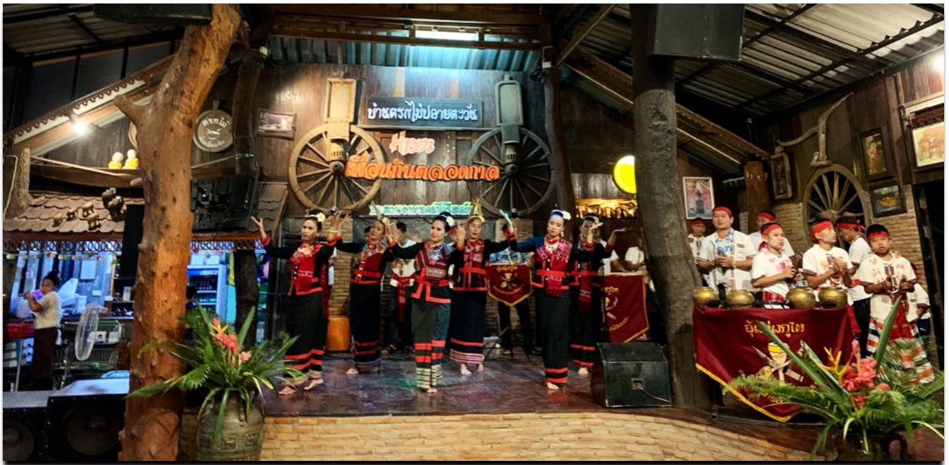
Folkloreabend mit lokalen Artisten und Musikanten – Mittanzen ist angesagt!