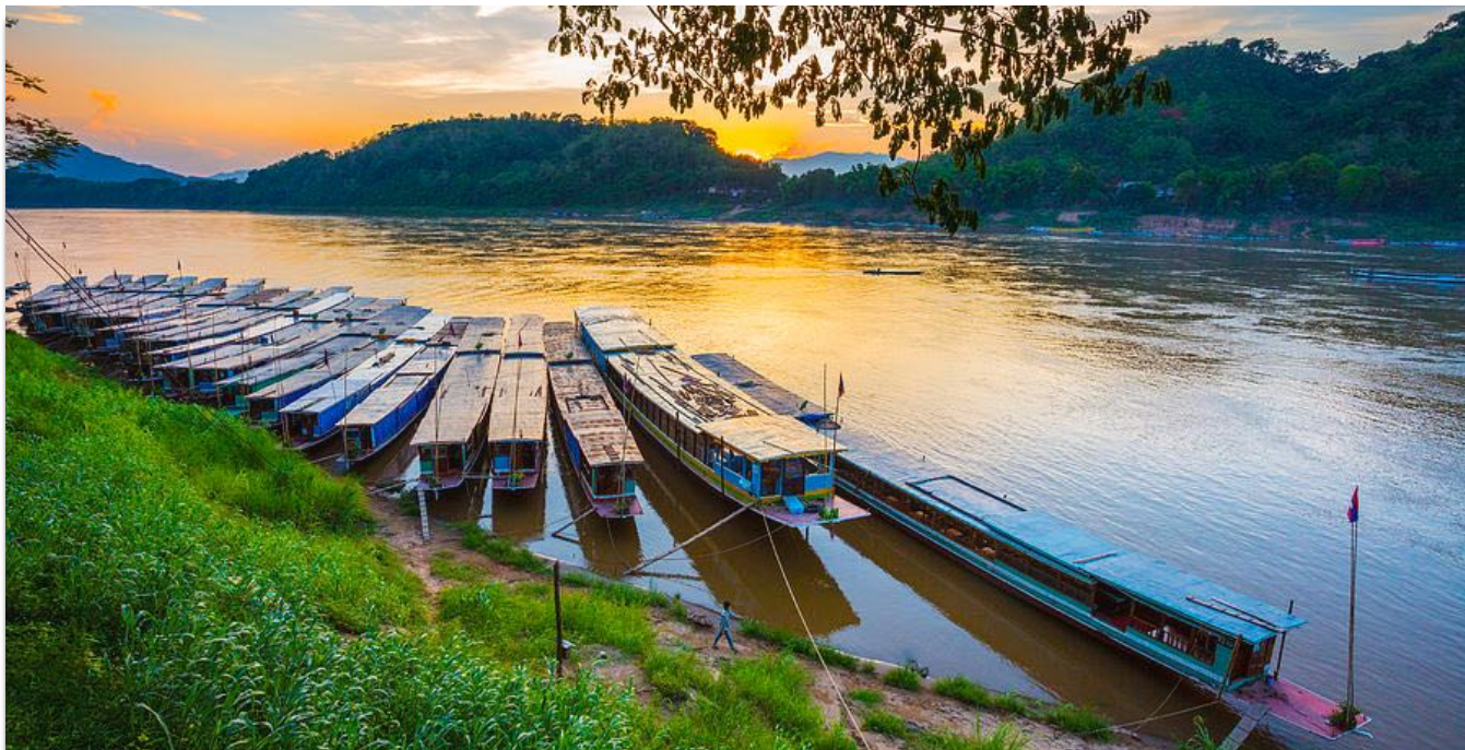
Geniesse atemberaubende Aussichten auf den legendären Mekong Fluss