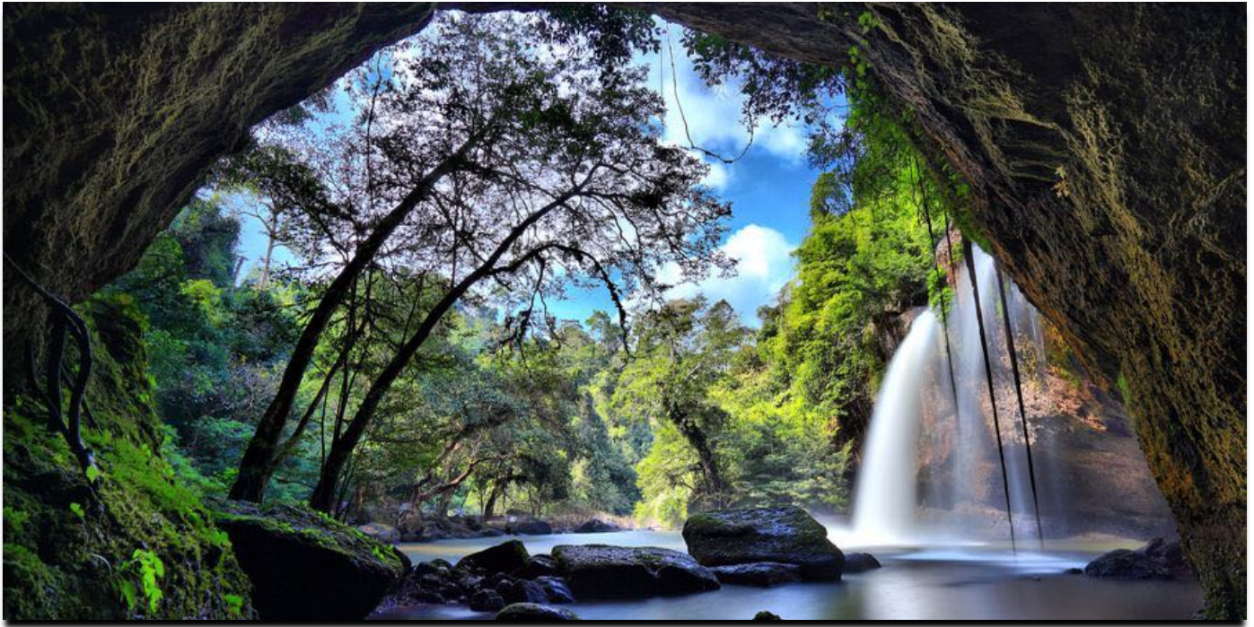
Es gibt viele, sehenswerte Wasserfälle im Khao Yai Nationalpark