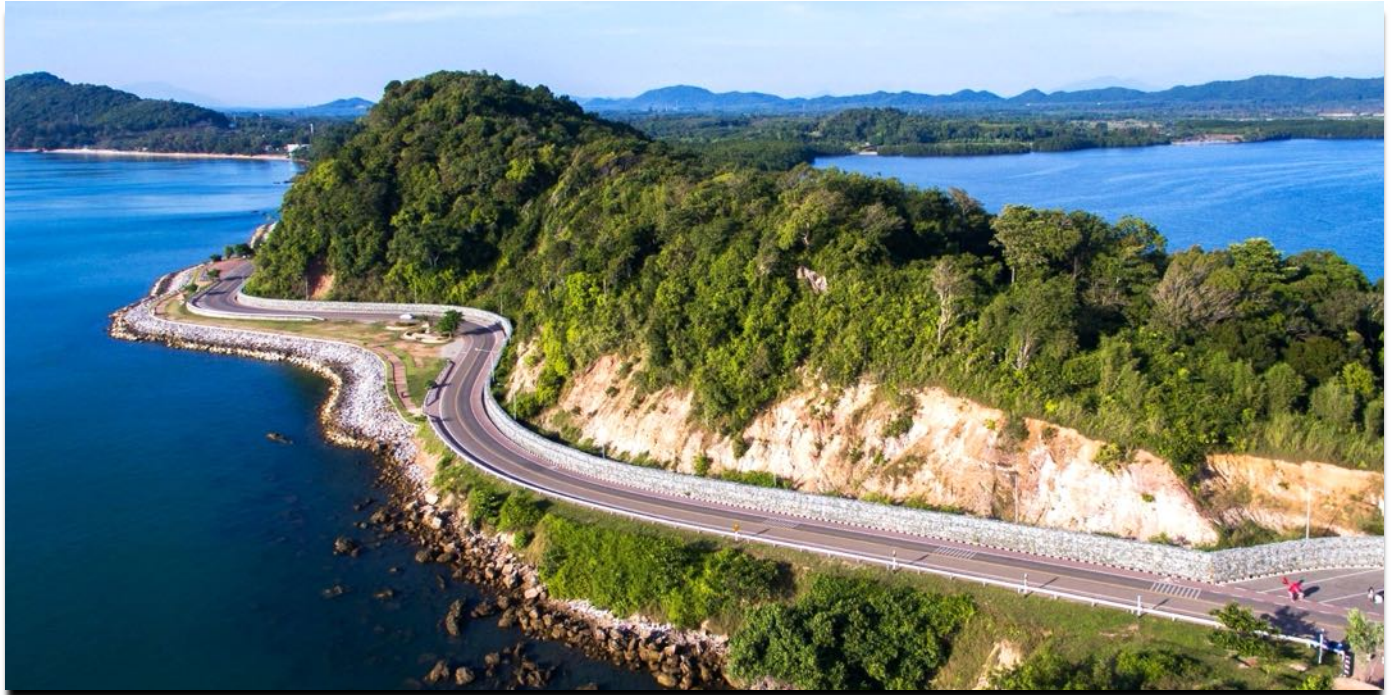
Eine traumhafte Küstenstrasse führt zum Noen Nang Phaya Aussichtspunkt in Chanthaburi