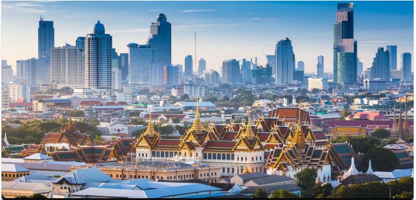
Bangkok die Stadt der Engel – Geschichte und Moderne liegen nahe beisammen.