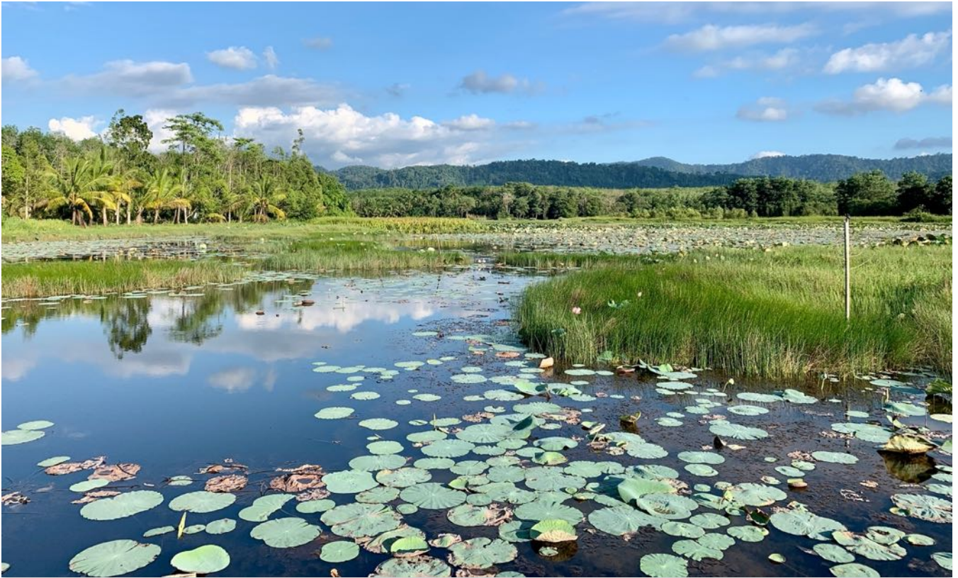
Khok Kloi, Phang Nga – Der Himmel auf Erden