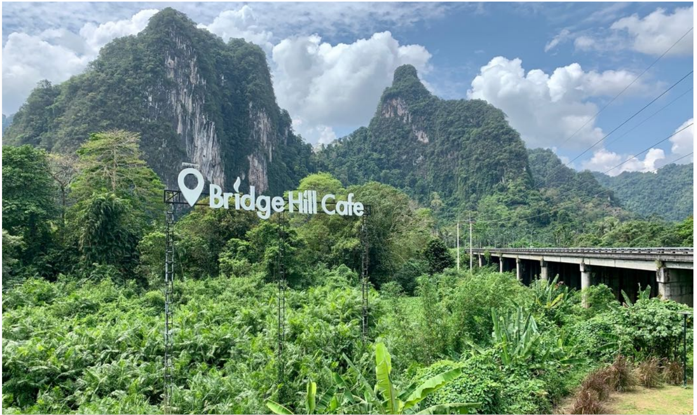
Atemberaubende Aussicht über die Kalksteingipfel des Khao Sok Nationalparks auf Etappe 6

Nach dem Frühstück verabschieden wir uns von Khok Kloi. Die Straße nach Phang Nga führt durch eine abwechslungsreiche, tropische Landschaft. Am Nachmittag gleiten wir in Langbooten durch eine Märchenwelt von Kalksteininseln, die von üppiger grüner Vegetation bewachsen sind. Der Phang Nga Bay Meeresnationalpark, ist bekannt für seine unberührten Mangrovenwälder und artenreiche Tierwelt. Vielleicht erkennen Sie die Felsformationen aus dem James-Bond-Film "Der Mann mit dem goldenen Colt", der der Reise den Namen "James Bond Island Tour" gab. ✕ F | M