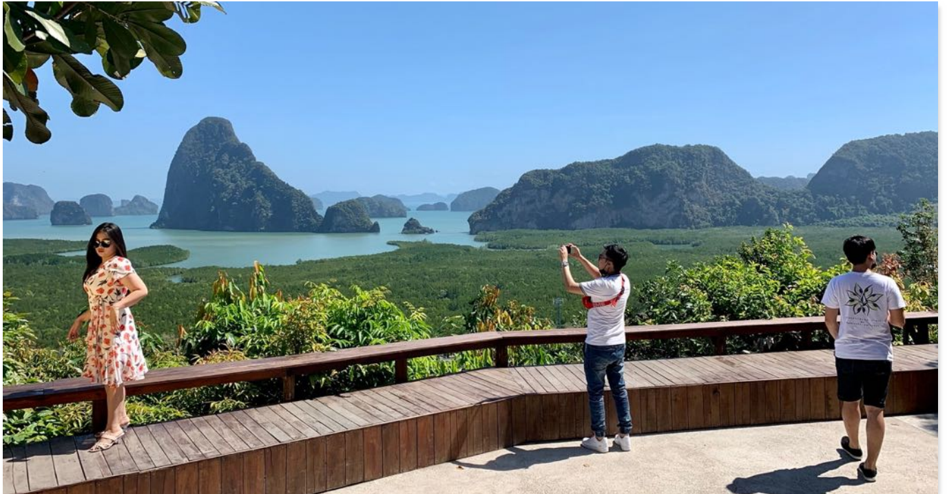
Ein absolutes Muss – Samed Nangshe Viewpoint Phang Nga Bay