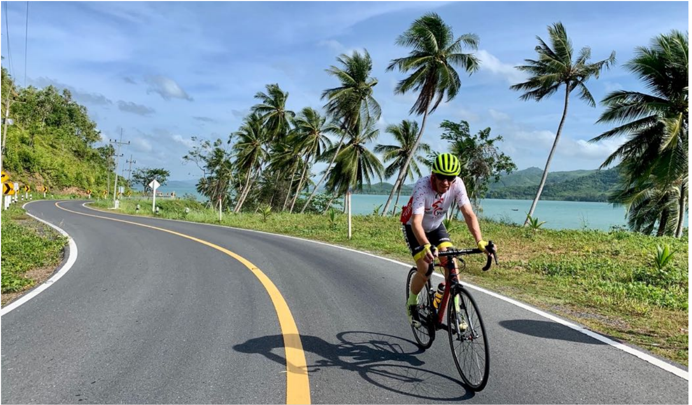
Die 2. Etappe führt nach Phuket zum Laem Sai Pier