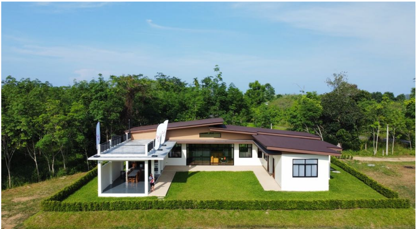
Chilli Cycling Terminal in Khok Kloi – Geniesse ein gezapftes Bier oder andere erfrischende Getränke