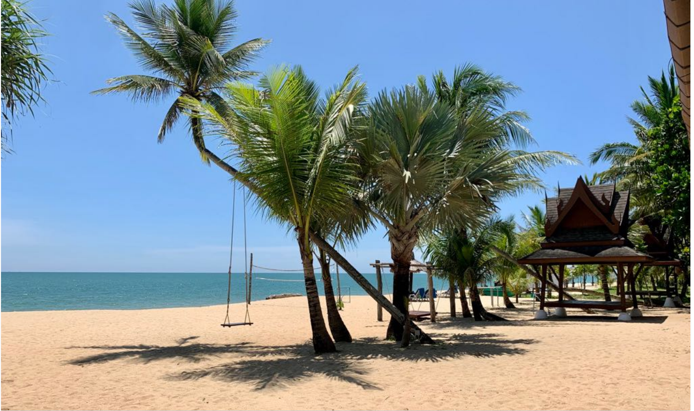
Entspannung am Strand in Khao Lak am 9. Tag

Mit Blick auf eine beeindruckende grüne Bergkulisse radeln wir nahezu verkehrsfrei durch Kautschuk- und Palmenwälder. Via Thung Maprao, erreichen wir auf perfekten Strassen, den Thai Muang Beach und geniessen eine gemütliche Kaffeepause. Wir folgen der farbenprächtigen Küstenstraße zurück zum Natai Beach. Die letzte Etappe endet mit Erinnerungsfotos vom majestätischen Natai Pier. Urlaubsverlängerungen können von uns arrangiert werden. ✕ F | M | A