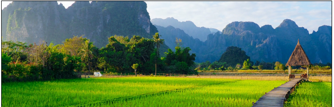
Nordthailand ist die wohl abwechslungsreichste Gegend im Königreich Thailand