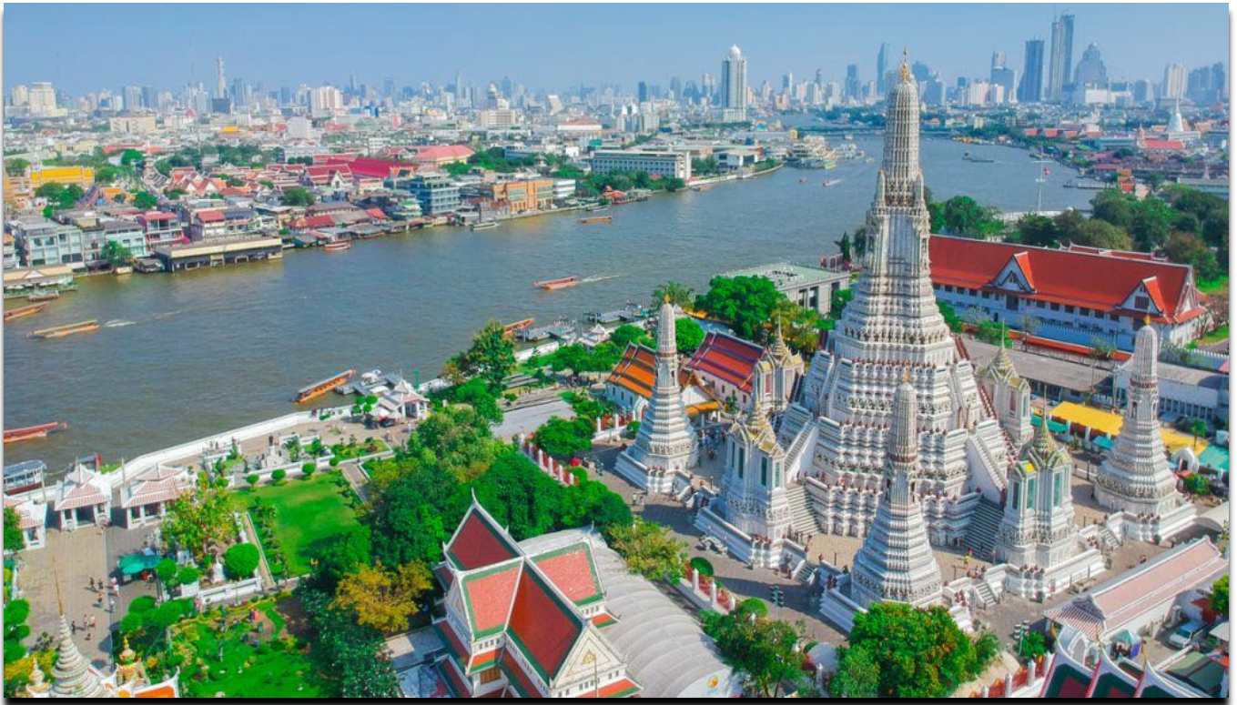
Bangkok: Chaopraya River mit Wat Arun Tempel