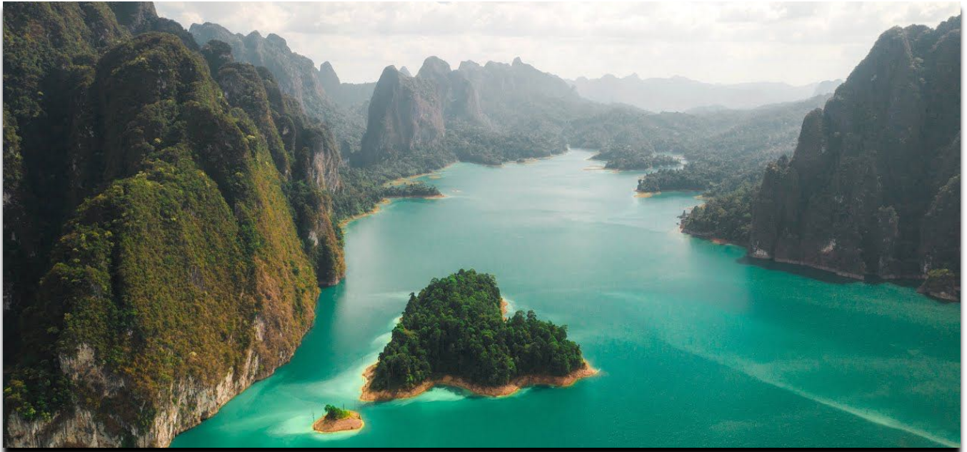
Naturwunder Khao Sok National Park – Chiew Larn Lake