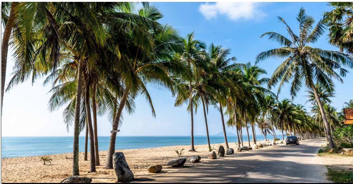
Ban Krut Beach – Immer noch ein Geheimtipp