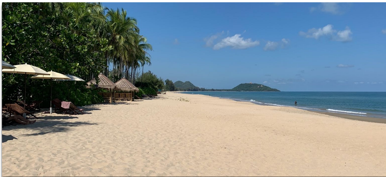
Traumstrand ganz für dich allein