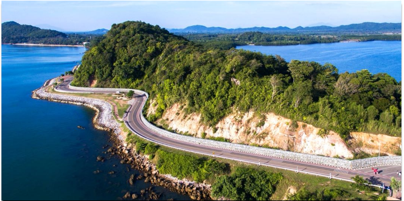
Eine traumhafte Küstenstrasse führt zum Noen Nang Phaya Aussichtspunkt in Chanthaburi